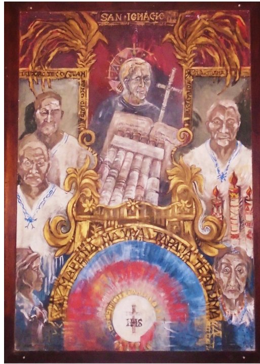
Figura 1. Pintura de los primeros caciques y mamas, del cabildo indigenal de San Ignacio de Moxos 31 .